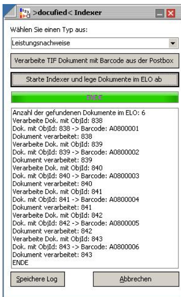
Abb. links: Verarbeitung je Belegtyp

Verarbeitungsschritt 1 TIF mit Barcode erkennen